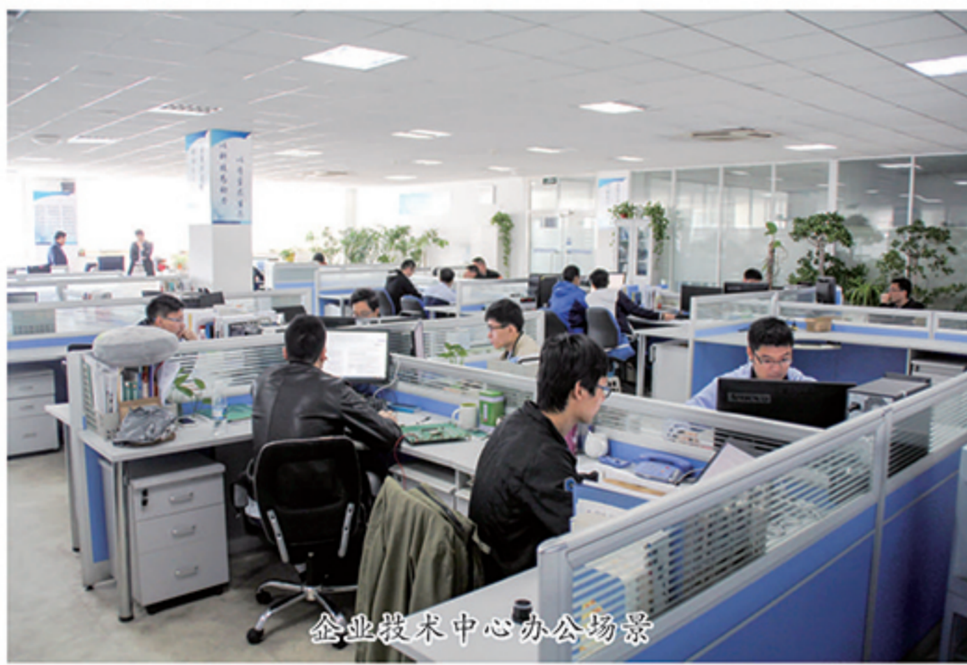
企业技术中心办公场景

实验室积极推进与产业链上下游企业的合作交流,海富光子、华拓光研、山东瑞择、远海声学、安伟联创